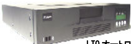
LTO オートローダー AL810