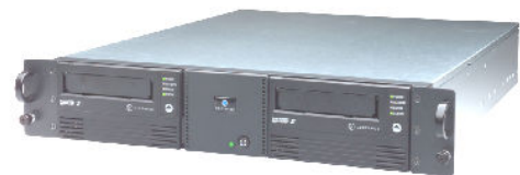
LTO2 Dual カートリッジ

お問い合わせ先: 株式会社ワークマンシップ / WORKMANSHIP Co., Ltd. http://www.workmanship.com